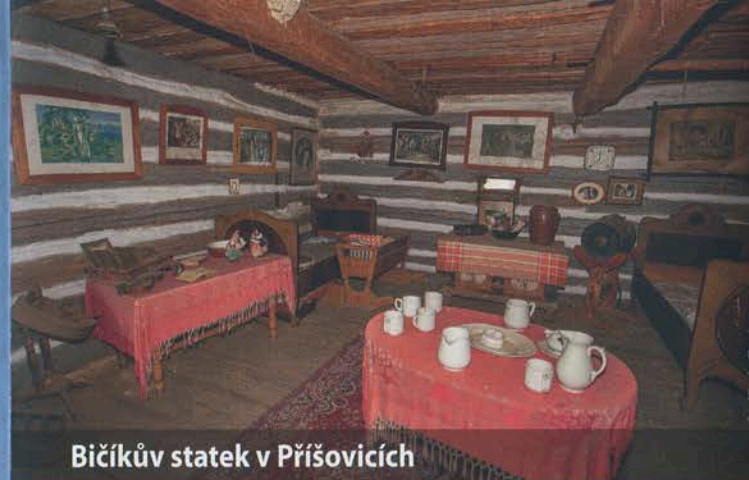
Bičíkův statek v Příšovicích