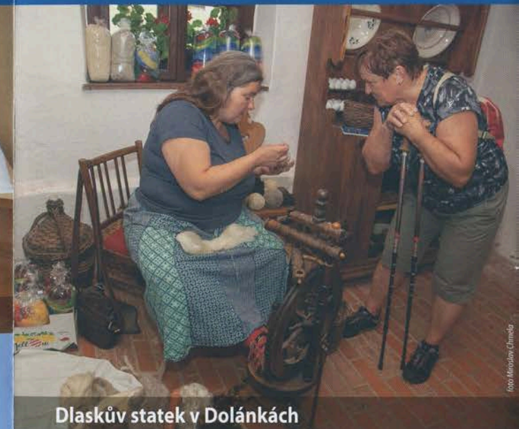
Dlaskův statek v Dolánkách

Otevírací doba: so 10.00 – 17.00; ne 10.00 – 17.00