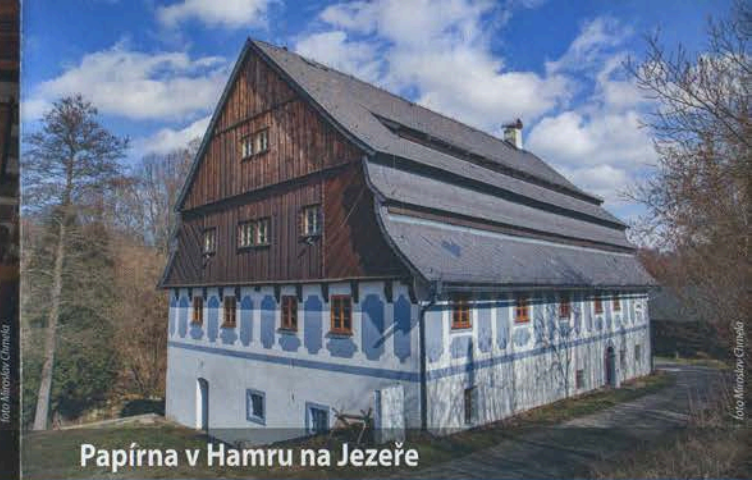
Papírna v Hamru na Jezeře

Viděli jste bájného Fénixe vstát z popela? Navštivte barokní papírnu v Hamru na Jezeře a uvidíte, jak se z ruiny rodí technický unikát Libereckého kraje. V roce 2017 získala obnova objektu titul „Památká roku 2017 Libereckého kraje“, cesta však ještě není u konce! Přijďte se podívat, co je hotové a co se chystá. Přípraveny pro Vás jsou komentované prohlídky s fotografickou výstavou obnovy.