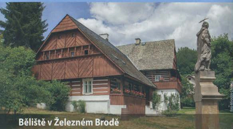
Bělíště v Železném Brodě

http://lidove-stavby.cz ; www.kraj-lbc.cz